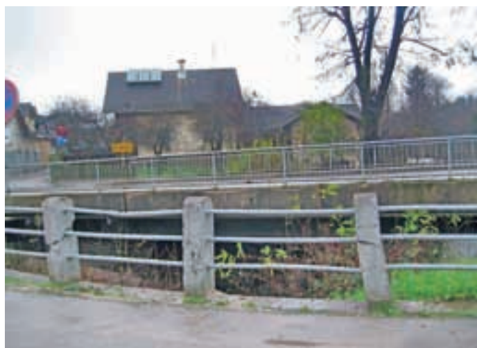
V načrtu je tudi obnova mostu čez Kokro.