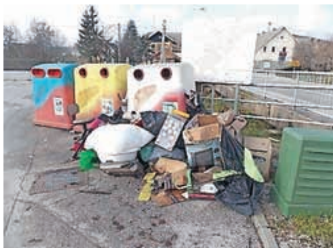
Ob ekološkem otoku se ne bi smelo ničesar odlagati, ampak ...

bo treba določene aktivnosti še izvesti, morda že v letu 2015. Z nogometnim klubom Britof in občinskimi vodstvom se bo treba resno pogovoriti v smeri pridobitve, povečave nogometnega objekta, ki bo ustrezal zahtevam Nogometne zveze Slovenije za igranje vsaj tretje slovenske lige ter prve in druge mladinske lige, kadetov in generacije U15.«