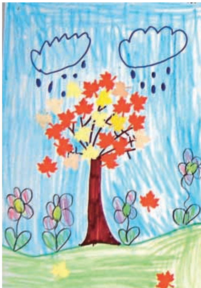
Viktorija Kačandol, 2. b