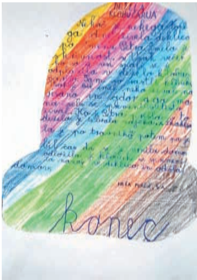
Neža Perčič, 3. a