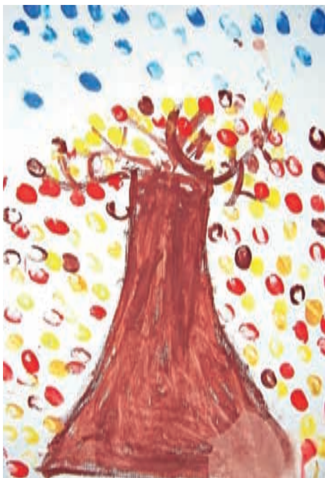
Ema Skodlar Kozamernik, 1. b