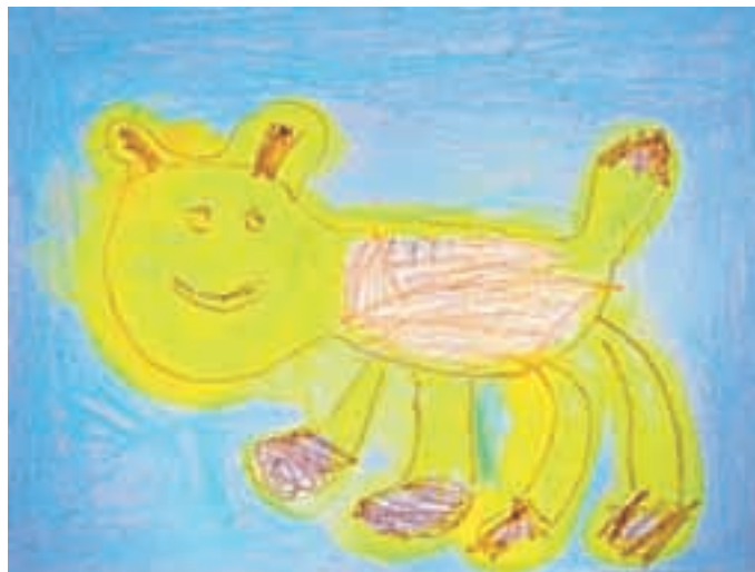
Matevž Ahlin, 2. b