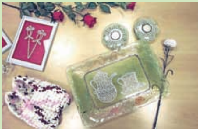
Nekaj ročnih del Ančke Lebar