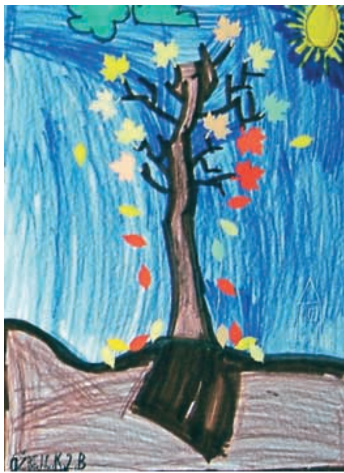
Ožbej Cehner Kuduzovič, 2. b