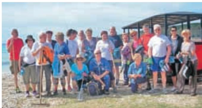
Konec maja so na povabilo Rozmanbusa preživeli kratek delovni dopust na Dugem otoku. Očistili so velik del plaž severno in južno od Božave in okolico hotela. Vodstvo hotela, tamkajšnje turistično društvo in tudi udeleženci akcije so bili zadovoljni z opravljenim delom.