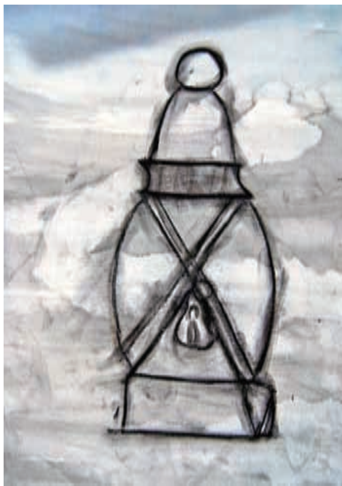
Špela Kocijančič, 1. b