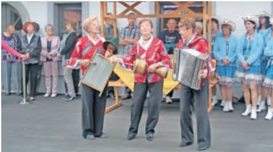
Britofške fraje so nastopile tudi na odprtju medgeneracijskega centra na Hujah v Kranju (na sliki). Pri DU Britof-Orehovlje se radi medgeneracijsko povezujejo, tudi z OŠ Predoslje.